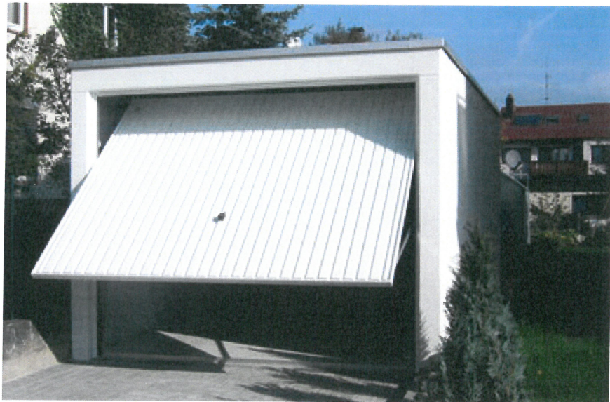
1. Fertiggerage aus Beton