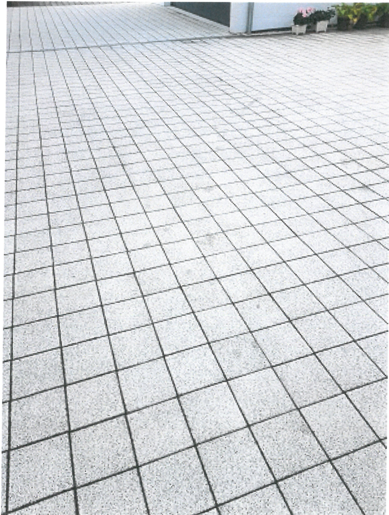
Fliesen, Stellplätze, Flächen unter Carports, Zufahrten, Fahrradstellplätze