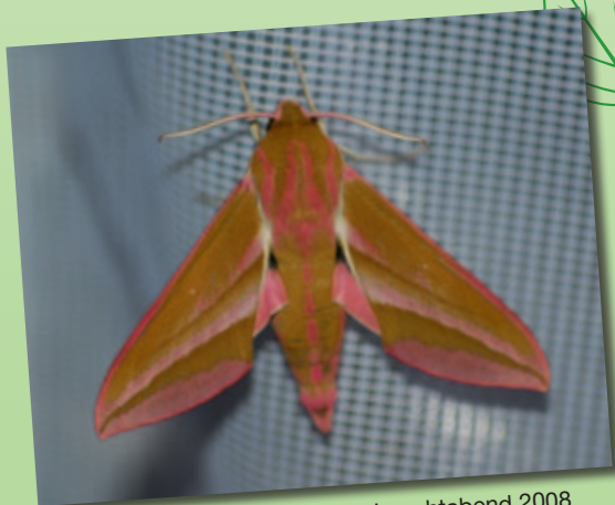
Deilophila elpenor - Nachtfalter Leuchtabend 2008

Eine Veranstaltung der Projektgruppe „Artenvielfalt“ der Lokalen Agenda 21 Hockenheim mit freundlicher Unterstützung von GEO