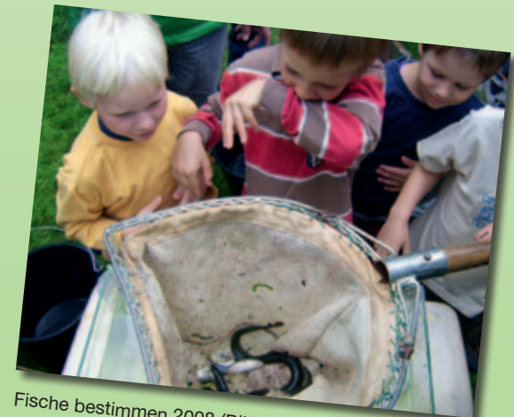
Fische bestimmen 2008