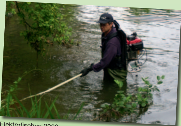
Elektrofischen 2008 (Bild: Kaschta)

Vom 11. bis zum 13. Juni 2010 laden wir Sie bereits zum 7. Mal herzlich zum Hockenheimer Tag der Artenvielfalt ein. Unser abwechslungsreiches Programm gibt Ihnen die Gelegenheit, Flora und Fauna in und um Hockenheim genauer unter die Lupe zu nehmen. Rund um das Schwerpunktthema „Biodrom und Mototop – Naturschutz im Ballungsraum“, erkunden wir gemeinsam den Hockenheimer Rheinbogen als wichtiges Kleinod vor unserer Haustür. Der Tag der Artenvielfalt bietet für jeden etwas, u.a. eine Wanderung nur für Kinder. Ergreifen Sie die zahlreichen Möglichkeiten mit Experten zusammen Nachtfalter, Fische, Vögel und die vielen Klein- und Kleinsttiere in natura und ganz nah zu erleben.