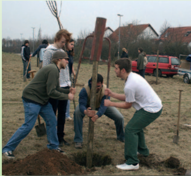
Pflanzaktion Streuobstwiese 2008

Freiwillige Helfer und Interessierte sind bei allen Aktionen sowie bei den regelmäßigen Treffen der Projektgruppe jederzeit herzlich willkommen.