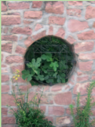
Stadtökologischer Spaziergang 2008