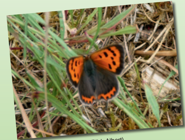
Expertenprogramm 2009

Treffpunkt: 14 Uhr Mörschhalle (Kleintierzüchter)