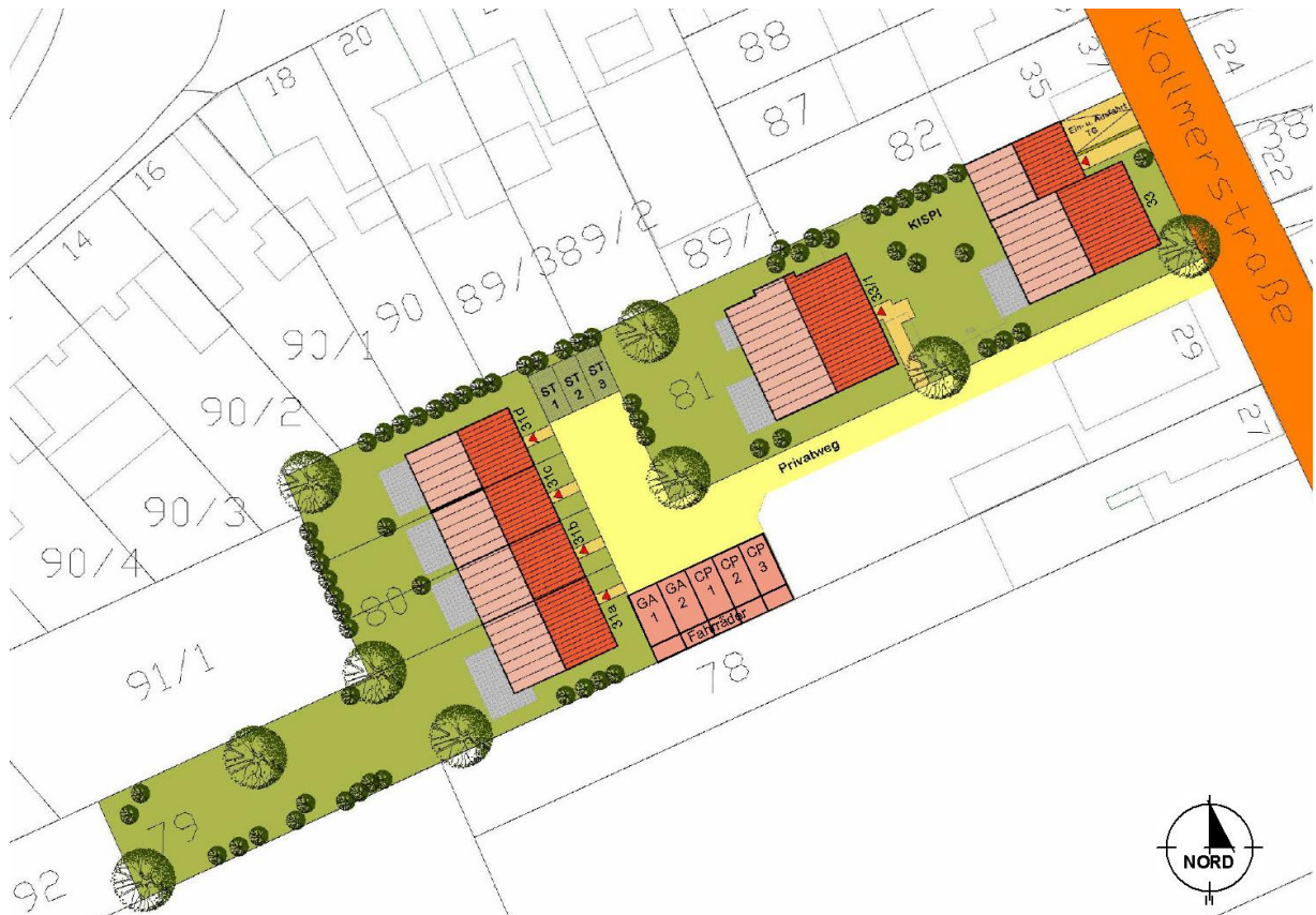
Abbildung 2: Darstellung des städtebaulichen Konzeptes