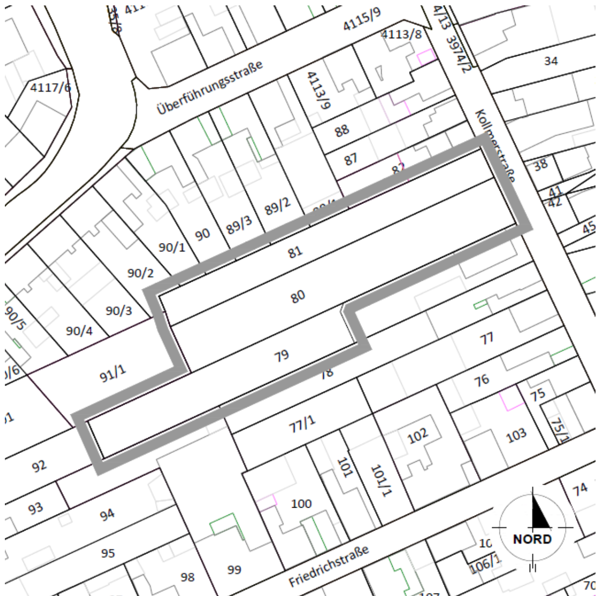
Abbildung 1: Darstellung des räumlichen Geltungsbereichs