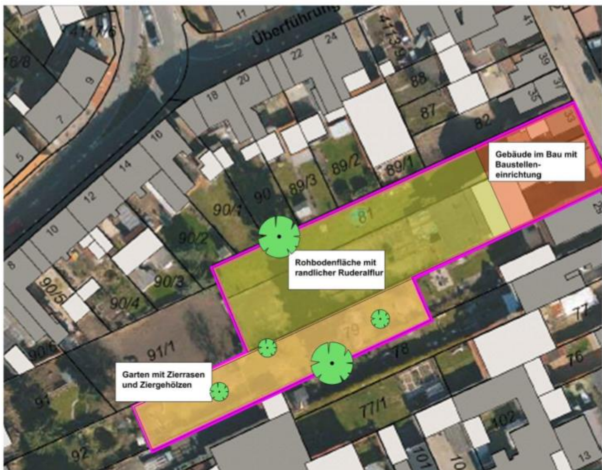
Abbildung 5: Vorhandene Biotope im Plangebiet

Quelle: PCU PlanConsultUmwelt Partnerschaft, ASP zum „vorhabenbezogenen Bebauungsplan Hockenheim Kollmerstraße 29-33“, 2019.