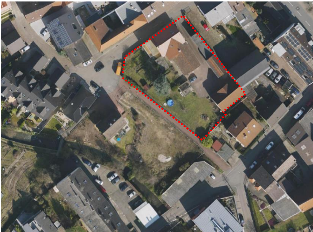
Abb.: Lage und Gebäudebestand Luftbild und Straßenfoto

Bei der heterogenen umgebenden Bebauung handelt es sich um ein- bis zweigeschossige Einzel-, Doppel- und Reihenhäuser an der Mittleren Mühlstraße mit unterschiedlichen Dachformen, viergeschossige Wohnbebauung auf der gegenüberliegenden Seite des Kraichbachs, zwei- bis dreigeschossige Bebauung bzw. eine eingeschossige Garagenanlage an der Oberen Mühlstraße.