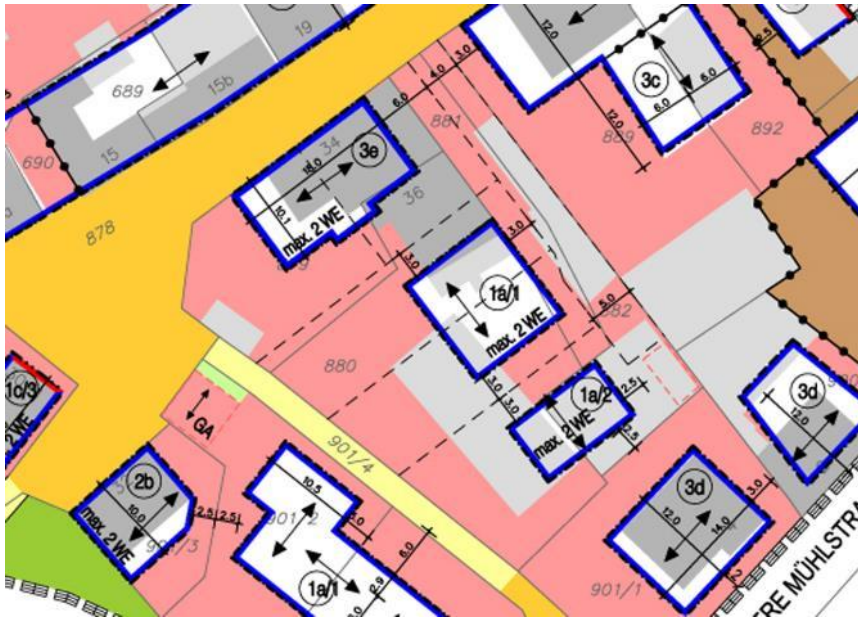
Abb.: Ausschnitt aus dem rechtskräftigen Bebauungsplan „Mittlere Mühlstraße“.