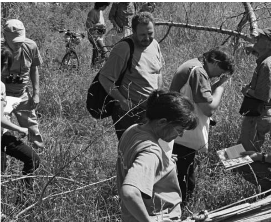
Artenvielfalt aus der Nähe betrachtet.

Erstmals war auch Hockenheim mit einem kurzen Beitrag in der Sonderbeilage der Zeitschrift „Geo“ zum Tag der Artenvielfalt vertreten. Die erzielten Arbeitsergebnisse werden regelmäßig in die Geo-Artenliste eingetragen und leisten damit nicht nur einen Beitrag, die Bürgerinnen und Bürger vor Ort zu informieren, sondern auch dazu, die Bestandsliste der Arten dieser Erde zu erfassen. Der Geo-Tag der Artenvielfalt findet mittlerweile in vielen Ländern weltweit statt.