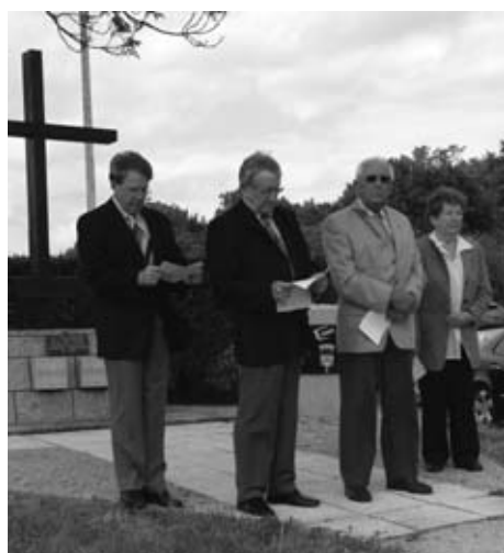
Reden am Völkerkreuz in Commercy.

„Völkerverständigung und Völkerrfrieden können nur dann Wirklichkeit werden, wenn jeder von uns zu seinem kleinen bescheidenen Teil an der Erreichung dieses Hochziels mitarbeitet“, sagte einmal Frankreichs früherer Staatspräsident Charles de Gaulle. Dieser Gedanke wird auch künftig einer der Maßstäbe der Zusammenarbeit zwischen Hockenheim und Commercy sein.