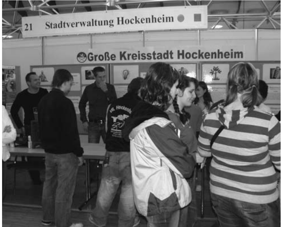
Die Stadtverwaltung Hockenheim beteiligte sich mit einem Stand am Ausbildungstag.

Die Stadtverwaltung ist der Ansicht, dass es sich auszahlt, in Bildung, Aus- sowie Weiterbildung zu investieren und man damit das Beste für den Nachwuchs tun kann. In gut ausgebildeten Menschen liegt die Zukunft unserer Gesellschaft. Das rege Interesse der Jugendlichen hat gezeigt,