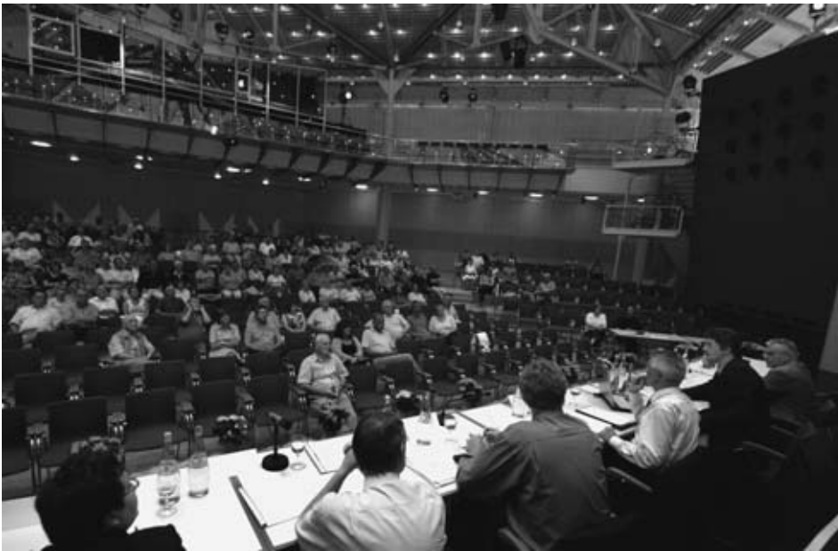
Gut besucht war die Bürgerversammlung in der Stadthalle, bei der die Lärmanalyse vorgestellt wurde.

Auch im Jahr 2007 lud die Stadt Hockenheim ihre Bürgerinnen und Bürger zu einer Bürgerversammlung ein, denn wichtige Gemeindeangelegenheiten sollen laut Gemeindeordnung in einer solchen mit den Einwohnern erörtert werden. Vom Büro Genest & Partner, das auch mit der Erstellung einer Lärminderungsplanung beauftragt ist, wurden die Ergebnisse der Lärmanalyse für das gesamte Stadtgebiet vorgestellt.