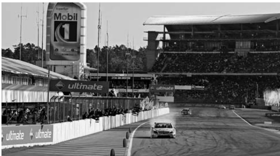
Zieleinlauf beim Saisonfinale der DTM.