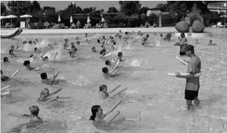
Spass und Action beim „H 2 O-Tag“.

ins Aquadrom. In einem Boot fuhr er am Nikolaustag übers Wasser, um allen