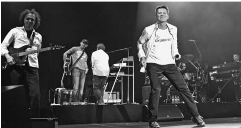
Hauptgruppe beim Jubiläums-Open Air des Hockenheimrings war die Band „Pur“ mit Frontmann Hartmut Engler.

In unmittelbarem zeitlichen Zusammenhang mit den Jubiläumsveranstaltungen des Monats Juli fand das Open-Air-Konzert mit der Gruppe „Pur“, der