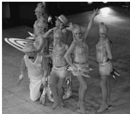
Ein Highlight im Programm: „Moscow Circus on Ice“

Im Las Vegas der fünfziger und sechziger Jahre hielten pittoreske Gestalten die Fäden in der Hand und das berühmte „Rat Package“ Frank Sinatra, Sammy Davis jr. und Dean Martin sowie Liza Minelli und „King“ Elvis waren die Superstars dieser Zeit. Genau das vermittelte die Show „Las Vegas Starlight“.