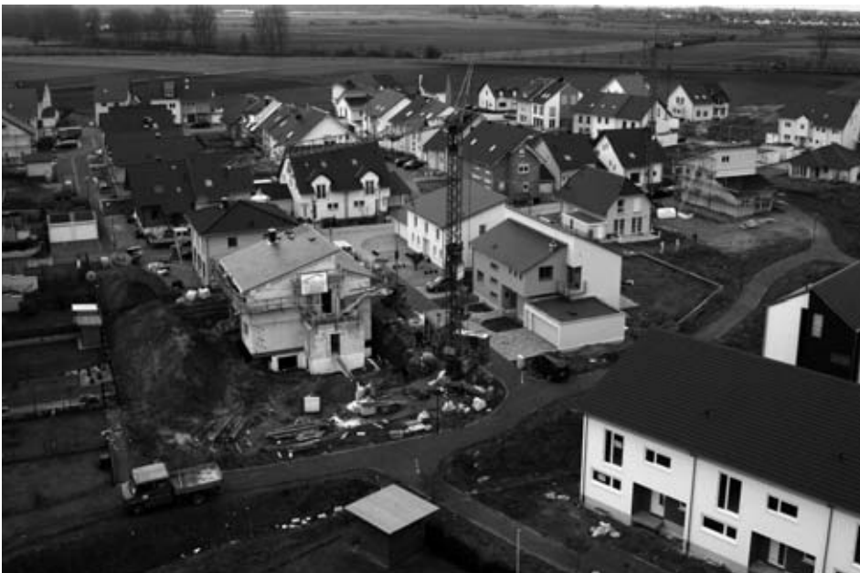
Baugebiet „2. und 3. Gewann Biblis, 2. Bauabschnitt“ erfreut sich großer Nachfrage.

Das vier Hektar große Baugebiet „2. und 3. Gewann Biblis, 2. Bauabschnitt“ erfreute sich auch im Jahr 2007 großer Nachfrage. Die Erschließung konnte bereits Ende November 2005 abgeschlossen werden. Die Erschließungskosten belaufen sich auf circa 1,6 Millionen Euro.