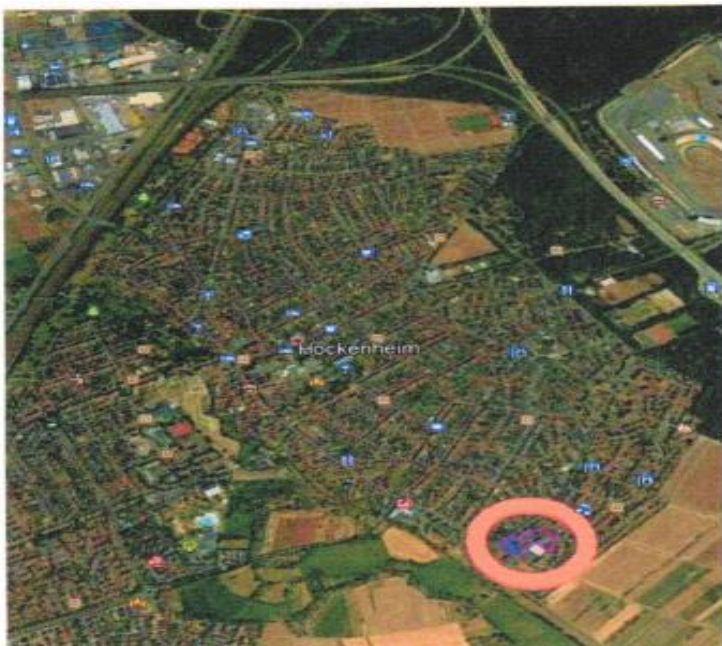
Luftbild Hockenheim, Lage des Grundstücks Hubäckerring/Max-Planck-Straße gekennzeichnet

Die Umgebung ist vorwiegend durch 2-4-geschossige Wohnbebauung in Form von Geschosswohnungsbau, Reihenhäuser und Doppelhäuser geprägt. Unmittelbar angrenzend befindet sich ein Lebensmitteldiscounter.