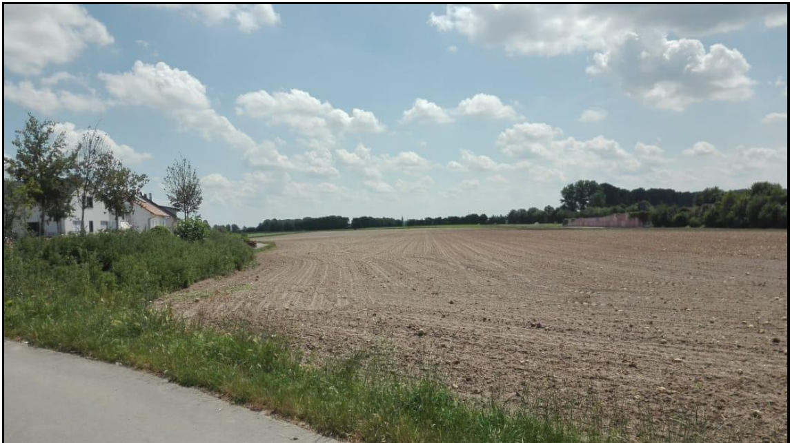
Abb. 4: Geltungsbereich mit Blick nach Osten parallel zur vorhandenen Wohnbebauung und der L 273