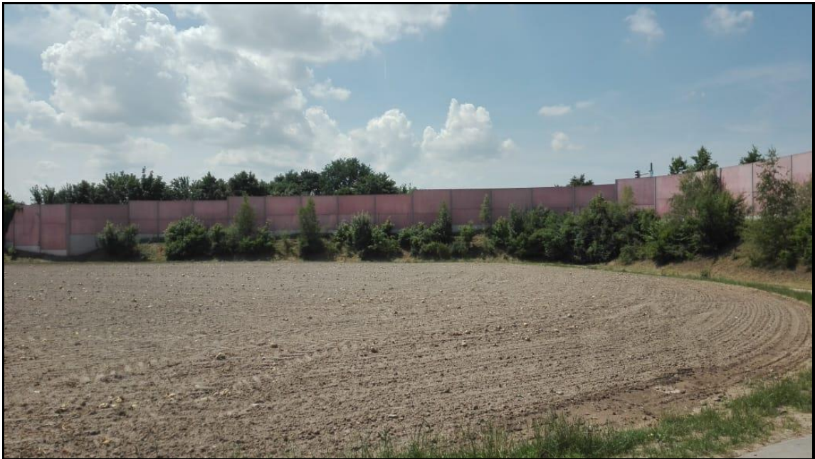
Abb. 2: Geltungsbereich mit Blick nach Süden zur L 273

Die Jungbäume und Gebüsche entlang des Hangs entlang der Lärmschutzwand parallel zur L 273 bestehen überwiegend aus typischen Feldgehölzen, die einigen störungstoleranten Vogelarten als Brut-, Rast- und Nahrungshabitate dienen.