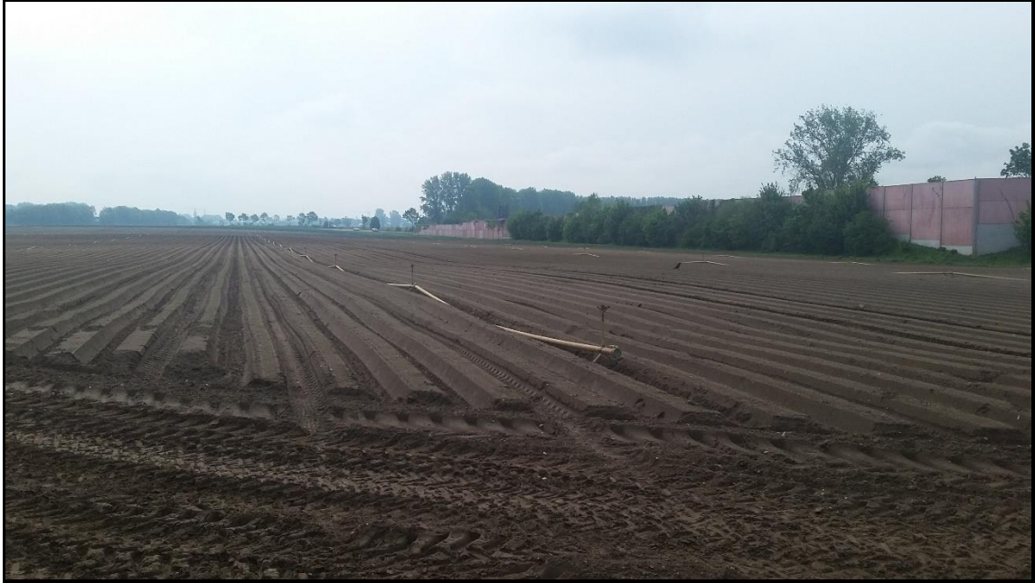
Abb. 3: Ackerfurchen und Wasserleitungen am 29.04.2019