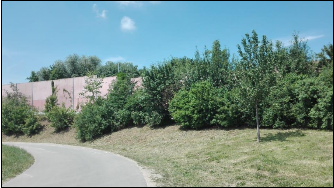
Abb. 5: Feldgehölze entlang der Lärmschutzwand